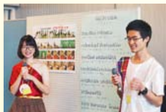
泰语的小叮当之歌

众多亲子组合参加了本次活动。并与来自美国，泰国，肯尼亚，尼日利亚的朋友一起做游戏，听歌，跳舞和开绘画图本的故事会。