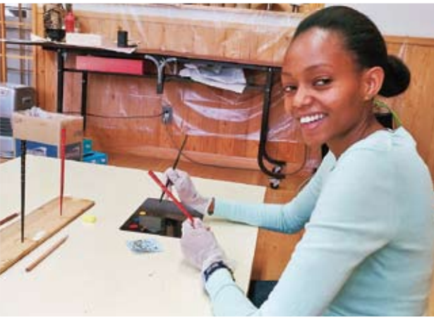
在【安比漆器工房】体验筷子的手工涂漆