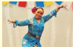
世界舞台「爪哇舞蹈」